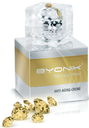
Regenerative Pflege mit anhaltendem Lifting-Effekt

Wer möchte nicht gern um ein paar Jahre jünger aussehen? Mit BYONIK® und anderen Hightech- Methoden wie TriLipo® lässt med fit Beauty Vital Center in Dornbirn unsere Falten und Linien einfach verschwinden und verhilft uns im Hand- umdrehen zu einem strahlend frischen, glatten Hautbild. Es ist ganz natürlich und keiner wird verschont. Zellprozesse, die für unsere jugendlich aussehende Haut verantwortlich sind, werden langsamer. Trockenheitsfältchen und Linien sind dabei die ersten, sichtbaren Zeichen. Die Elasti- zität nimmt ab, unsere Gesichtskonturen werden deutlich schlaffer. Die menschliche Haut ist im Laufe der Jahre immer weniger in der Lage, genü- gend Feuchtigkeit in der Haut zu speichern, und ohne Feuchtigkeit verliert sie nun mal ihre Straff- heit und den glatten Teint.