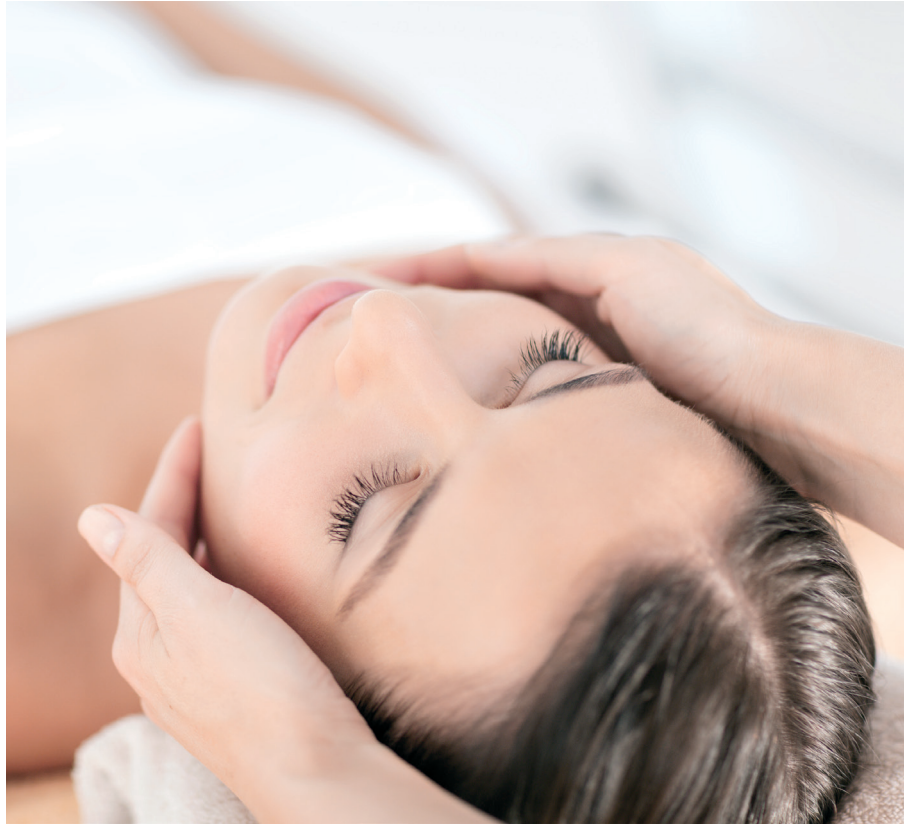
Mit der exklusiven BYONIK® -Behandlung erwacht müde Haut zu neuem Leben

Hautverjüngung und Pfle- geerlebnis auf höchstem Niveau: Hightech-Methoden und langjährige Erfahrung im Hautpflegebereich brin- gen außergewöhnliche Ergebnisse.